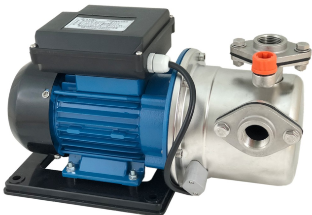
EKLBJ-4120 ; EKLBJ-4125